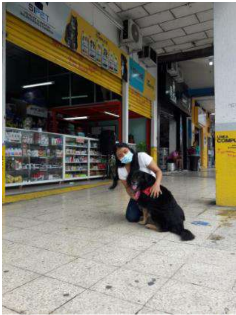
Figura 2 Encuesta a los consultorios veterinarios del Parque Chile