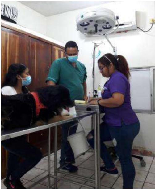
Figura 3 Atención que recibió Campeón en el Parque Chile