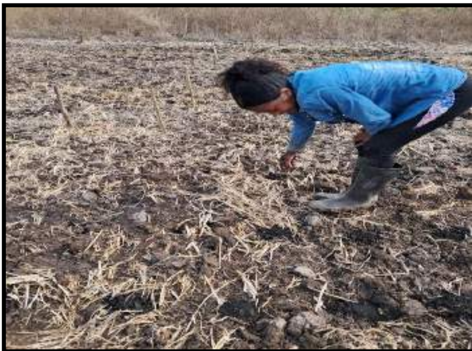
Figura 6. Siembra de pimiento