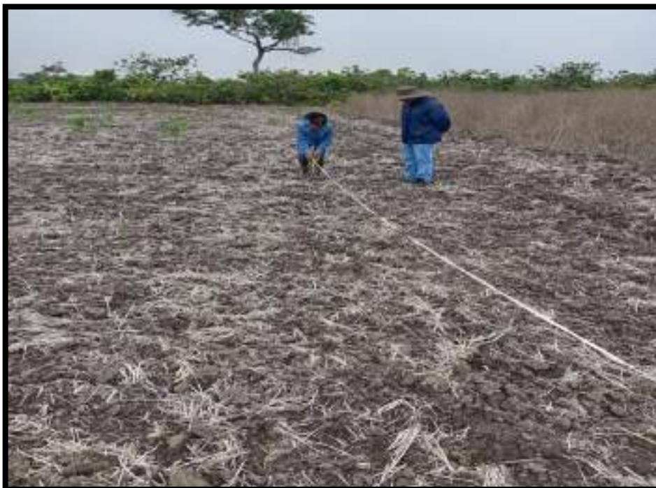
Figura 5. Delimitación de parcelas