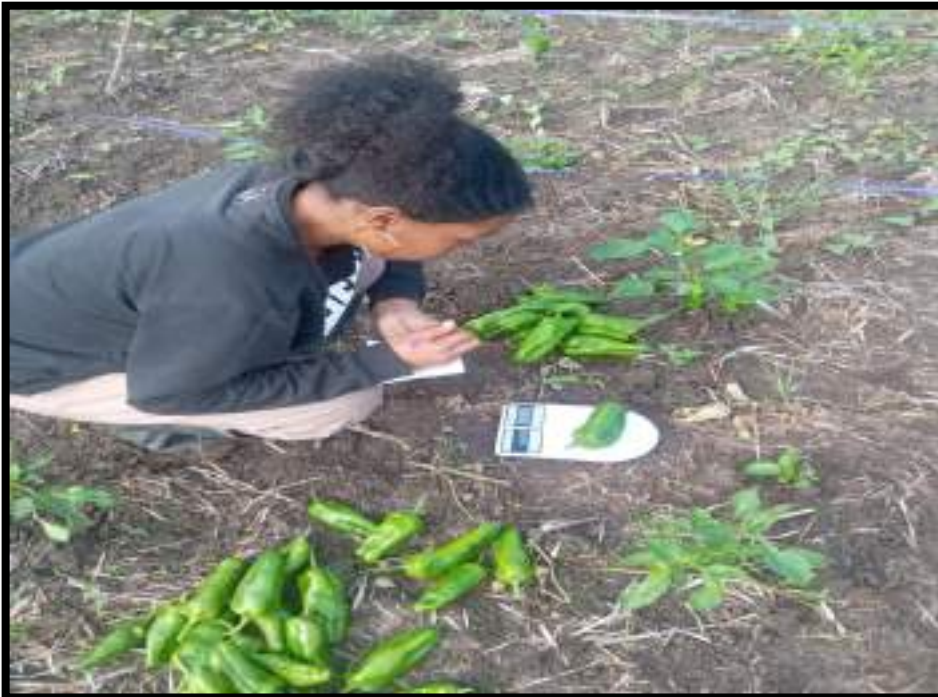
Figura 16. Toma de datos peso de pimiento