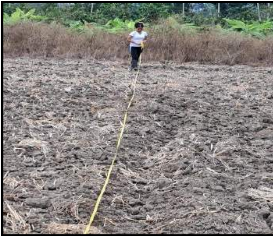
Figura 2. Medición de parcelas