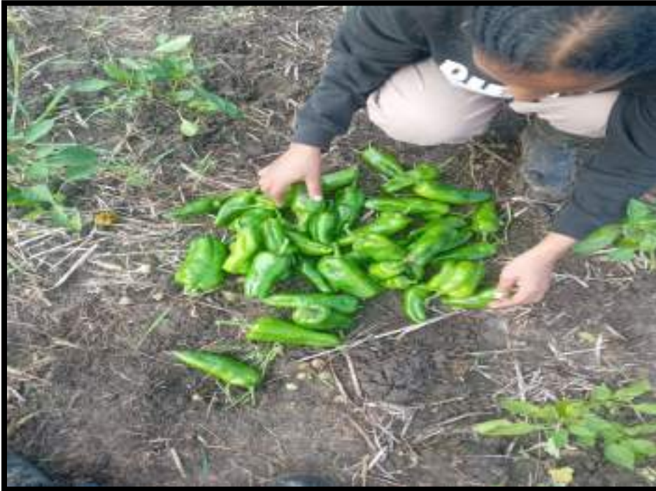
Figura 15. Recolección de frutos