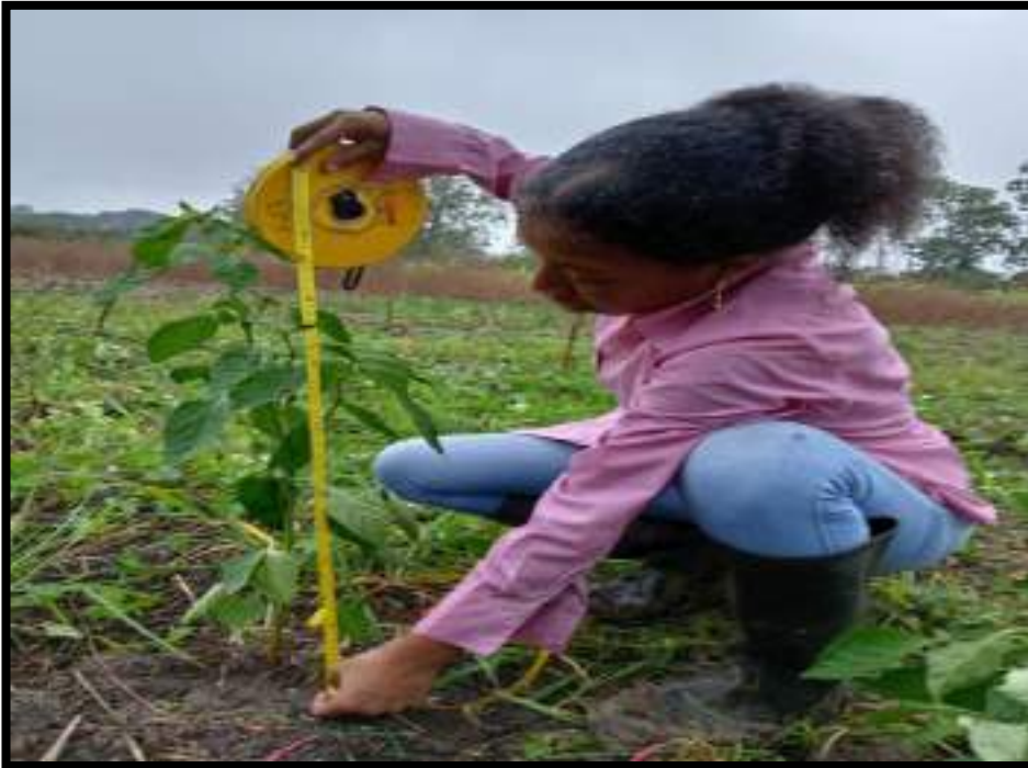
Figura 13. Toma de dato altura de planta