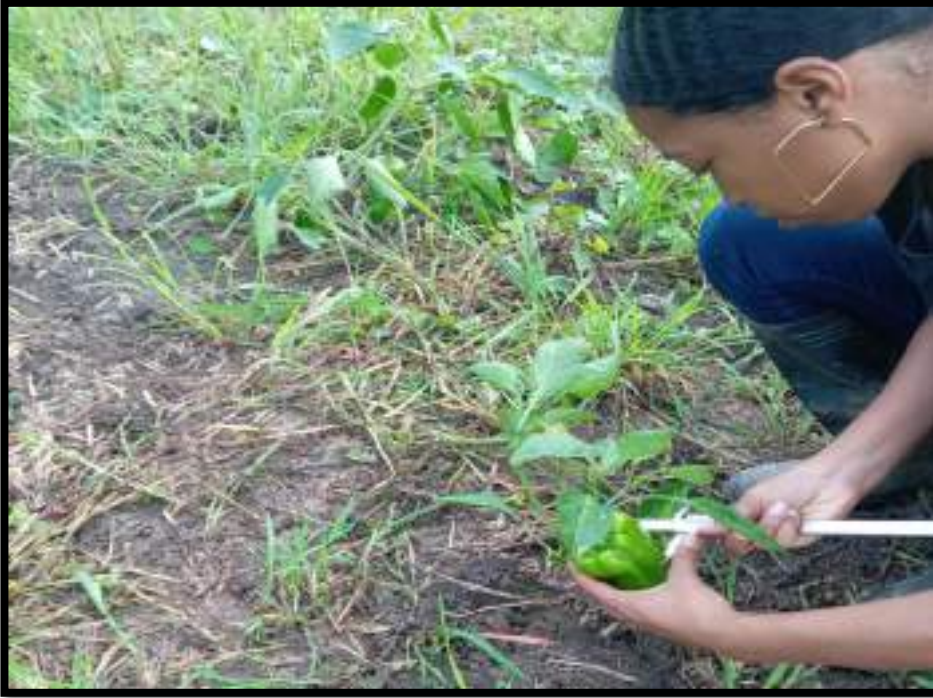
Figura 9. Uso de calibrador