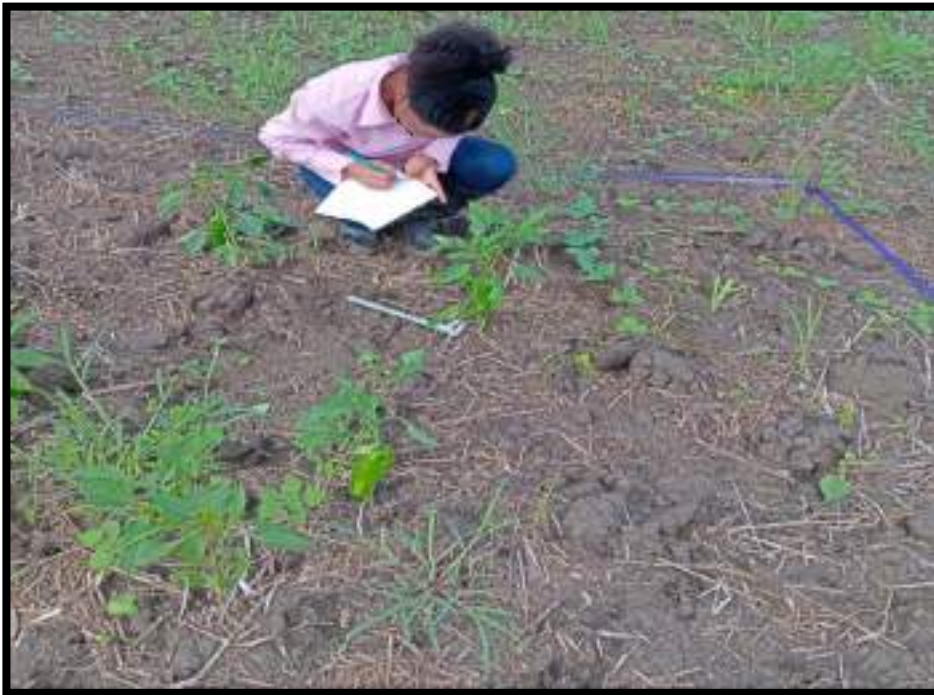
Figura 8. Crecimiento vegetativo del cultivo