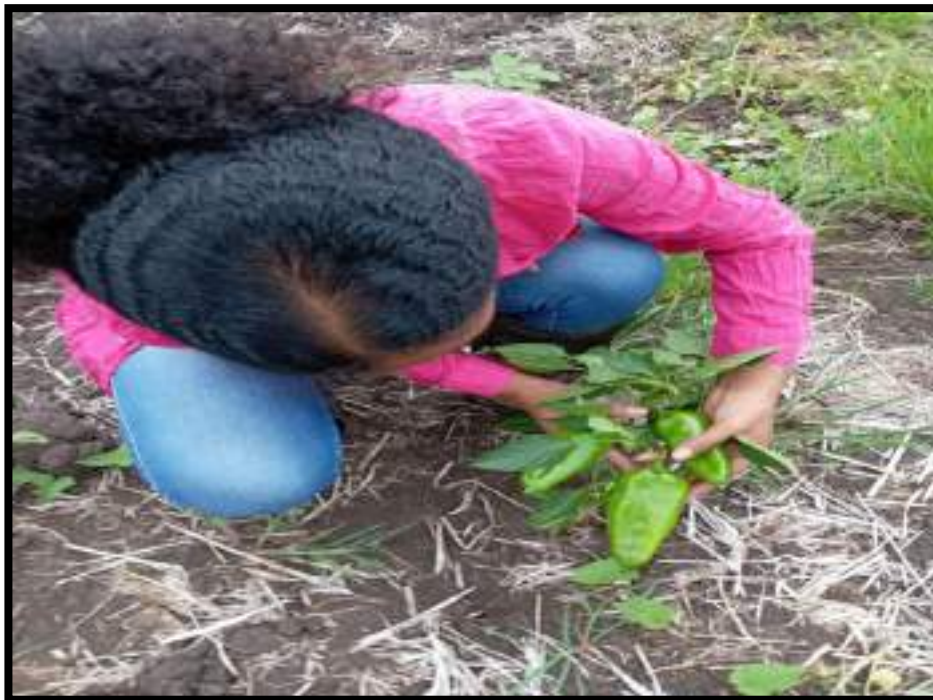
Figura 11. Inspección técnica del rendimiento