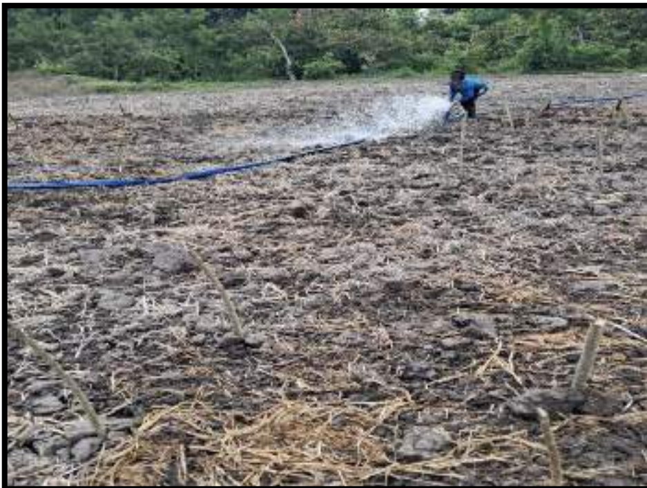
Figura 4. Instalación de sistema de riego