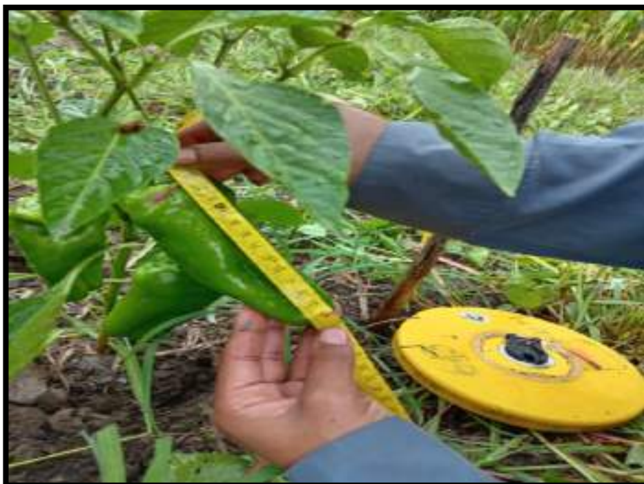
Figura 12. Toma de datos longitud de fruto