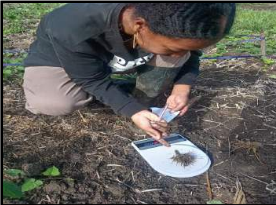
Figura 14. Peso de raíz