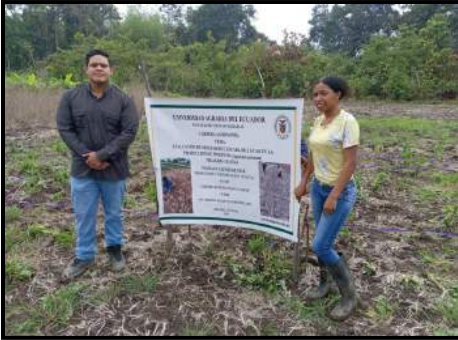
Figura 7. Visita del tutor guía