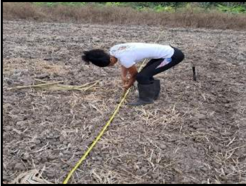
Figura 3. Colocación de estacas