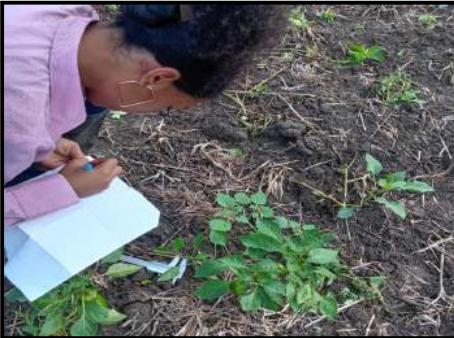
Figura 10. Recolección de datos