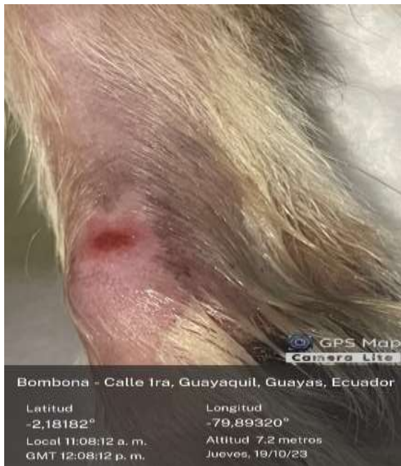
Ilustración 2 Lesión de paciente en la primera semana