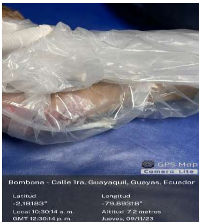
Ilustración 8 Esquema, bolsa de insuflación en extremidad