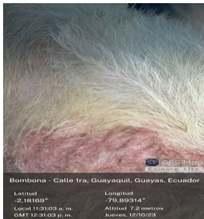
Ilustración 9 Paciente con lesión, semana 1