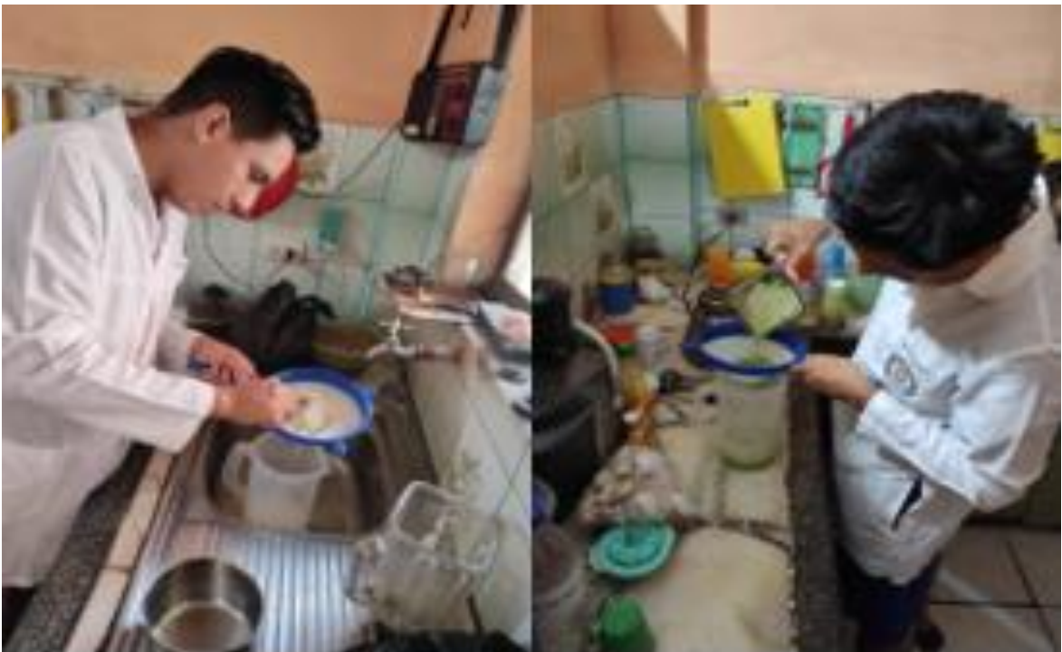
Figura 6. Preparación de los biopreparados Acaro, 2022