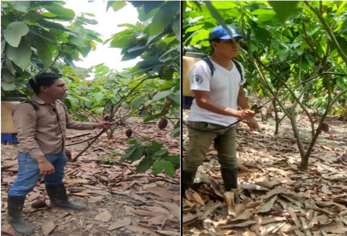
Figura 9. Aplicación de los biopreparados día 15 y 30 Acaro, 2022