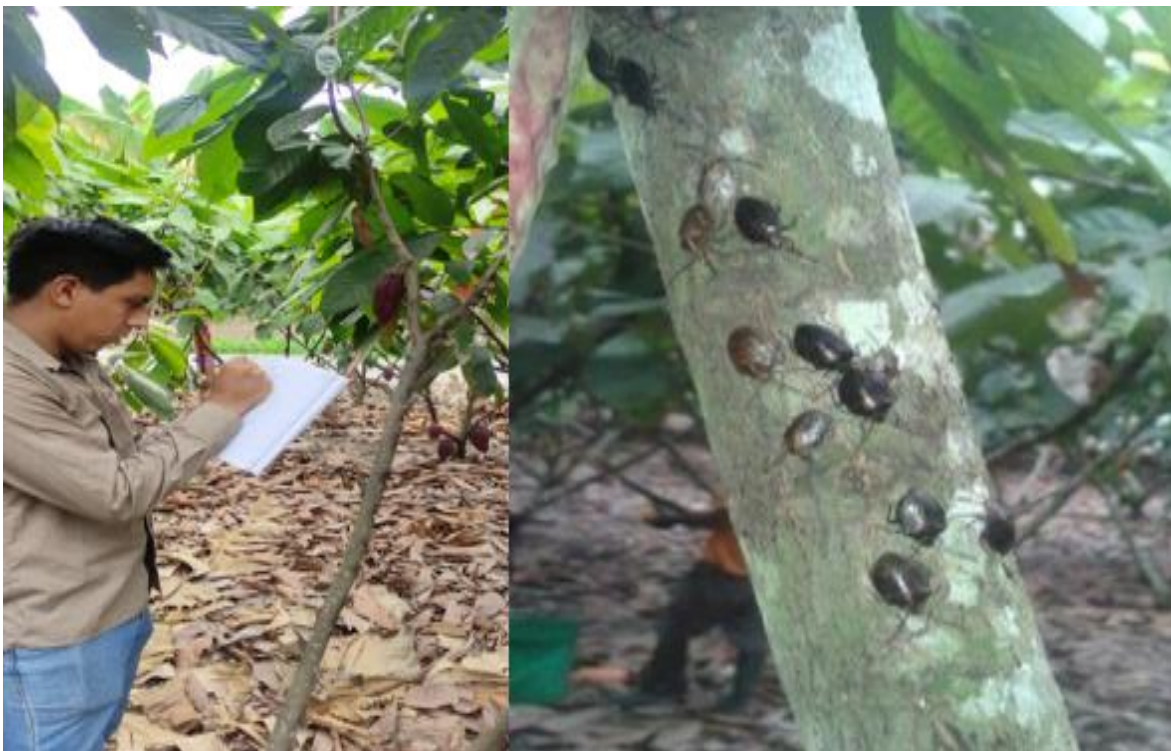
Figura 10. Toma de datos de población de chinchas Acaro, 2022