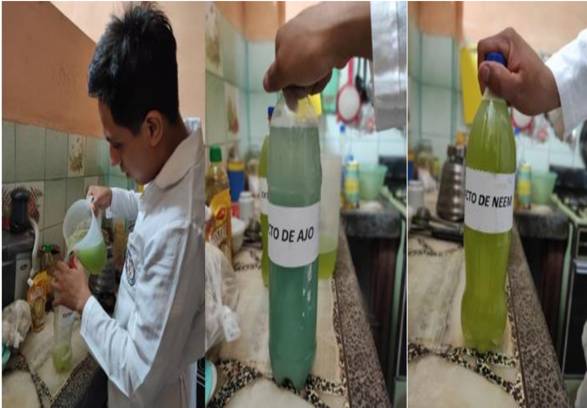
Figura 7. Resultado final de los biopreparados de ajo y Neem Acaro, 2022