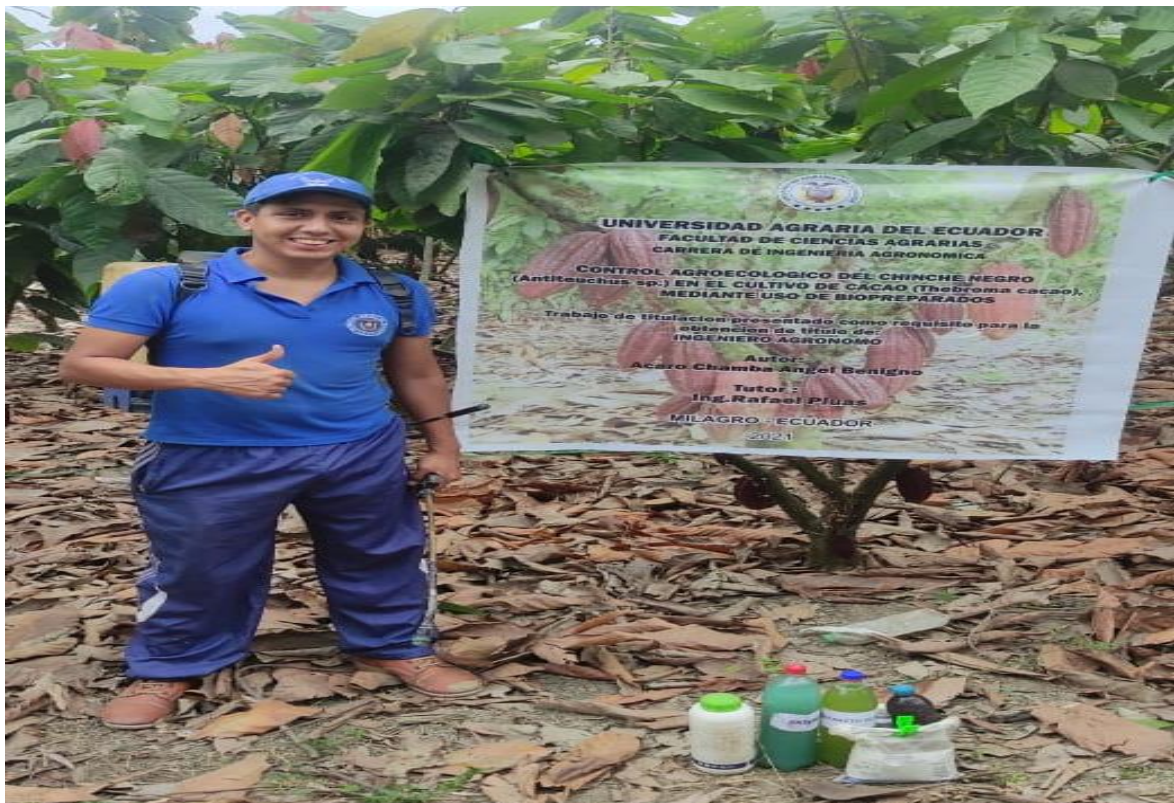
Figura 8. Aplicación de los biopreparados día 1 Acaro, 2022