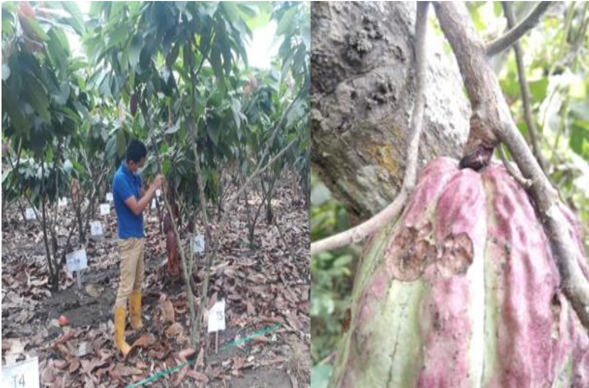
Figura 11. Toma de datos de daños en las mazorcas Acaro, 2022