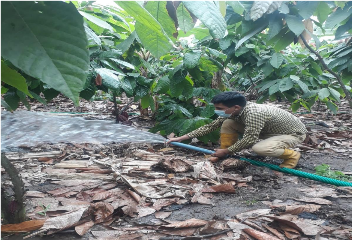
Figura 5. Aplicación de riego por gravedad Acaro, 2022