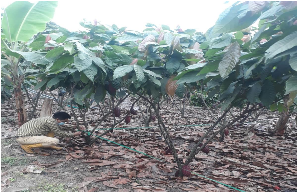
Figura 3. Separación de las parcelas útiles Acaro, 2022