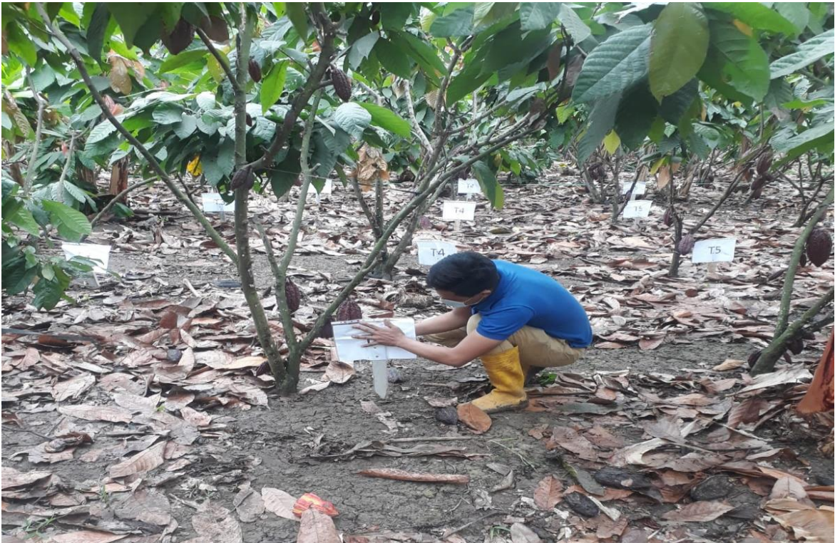
Figura 4. Colocación de letreros de identificación de los tratamientos en estudio Acaro, 2022