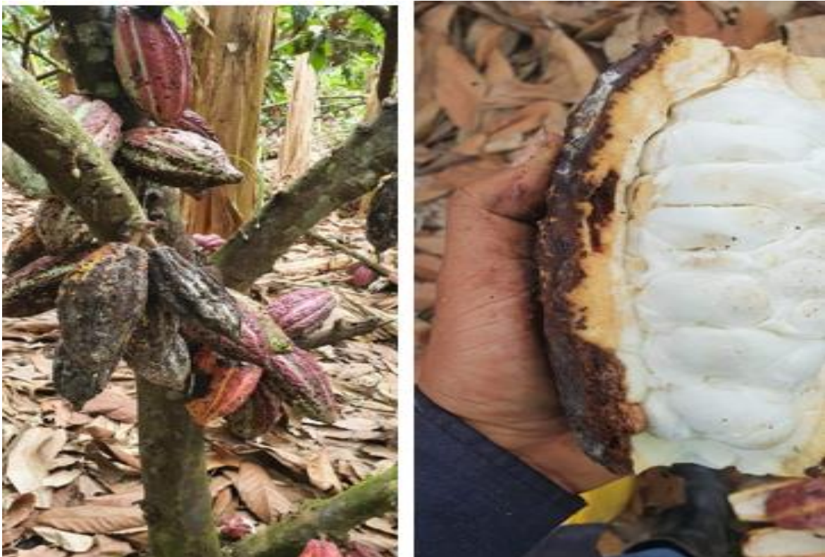
Figura 12. Daños causados por chinches en mazorcas de cacao Acaro, 2022