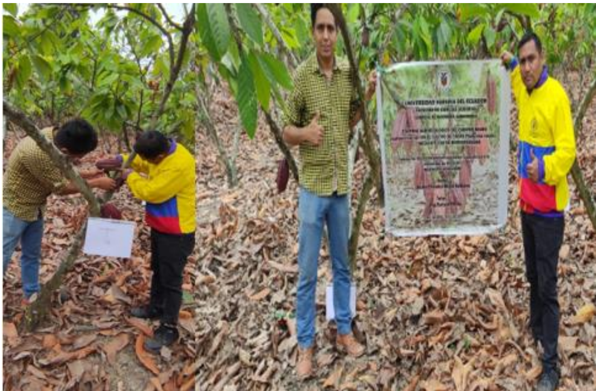
Figura 14. Visita del docente guía del proyecto Acaro, 2022