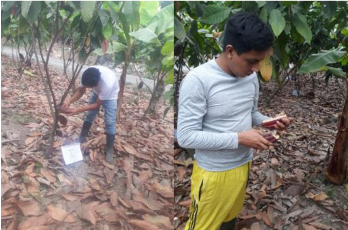
Figura 13. Cosechas de las mazorcas de cacao Acaro, 2022